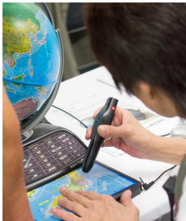
地球儀を触りタッチすると音声情報が流れる機器

ニーズに応じた多 種の機器。また歩 行、読み書き、通 信、日常生活、娯 楽など目的に応じ た多様な機器が多 数出展され、お客 様からは、見たい 物、探していた 物、役に立つ物が見 られたという声が多 く聴かれました。