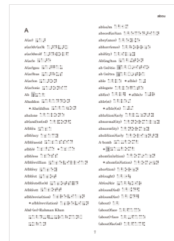
7 ページ (裏面、実物大)